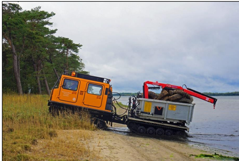
Abb. 19 / Abb. 17-20: Das Hagglunds voll beladen - die letzte Fuhre