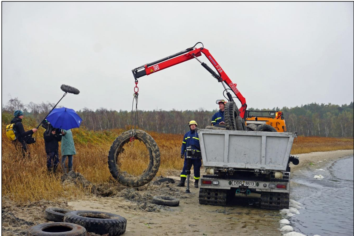
Abb. 15: Selbst Traktoren-Reifen werden geborgen