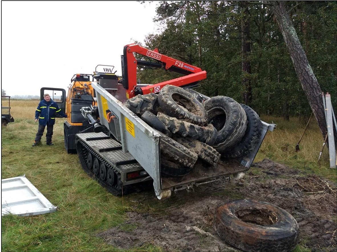
Abb. 7: Abladen der Reifen an der Anlandestelle