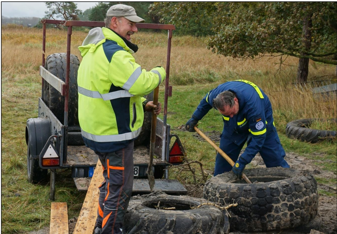
Abb. 8: Säubern und Verladen der Reifen für den Transport zum Zwischenlagerplatz