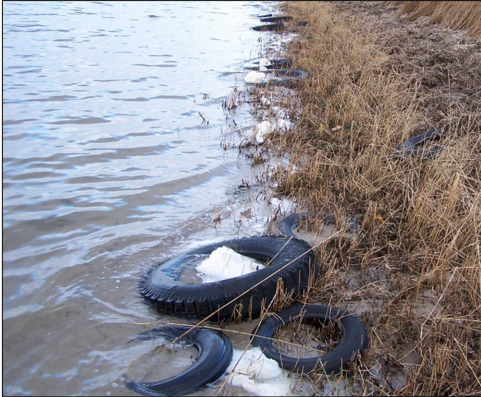
Abb. 1: Altreifen am Salzhaff-Ufer/Hellbach-Mündung (Foto: NABU, Winter 2018/19)