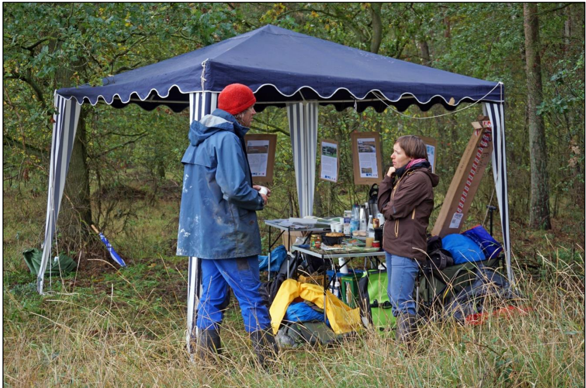
Abb. 16: In den Pausen gibt's Verpflegung, Infos und die Möglichkeit zum Erfahrungsaustausch