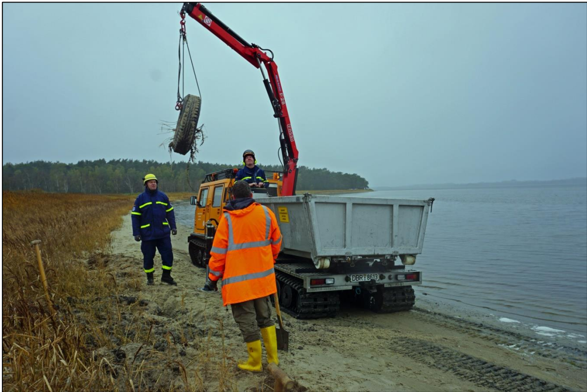
Abb. 13: Mit dem Häggglunds-Kran werden die Reifen aus dem Schilf-durchwurzeltten Untergrund gelöst bzw. „herausgerissen“