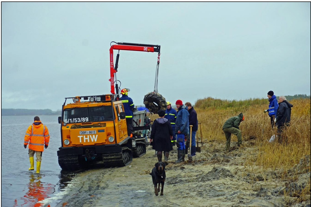
Abb. 6: Verladen der Reifen