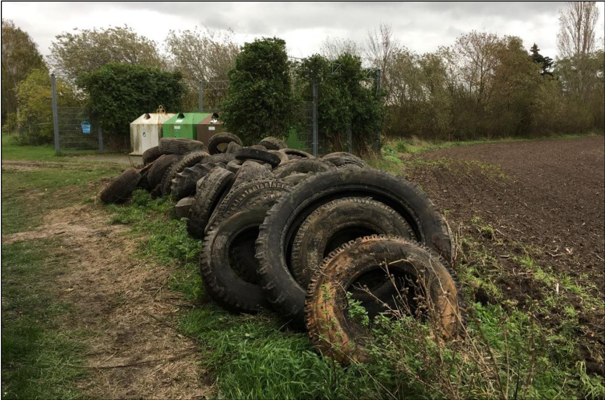
Abb. 21: Am Ende liegen 89 Reifen am Zwischenlagerplatz in Teßmannsdorf zur Abholung bereit