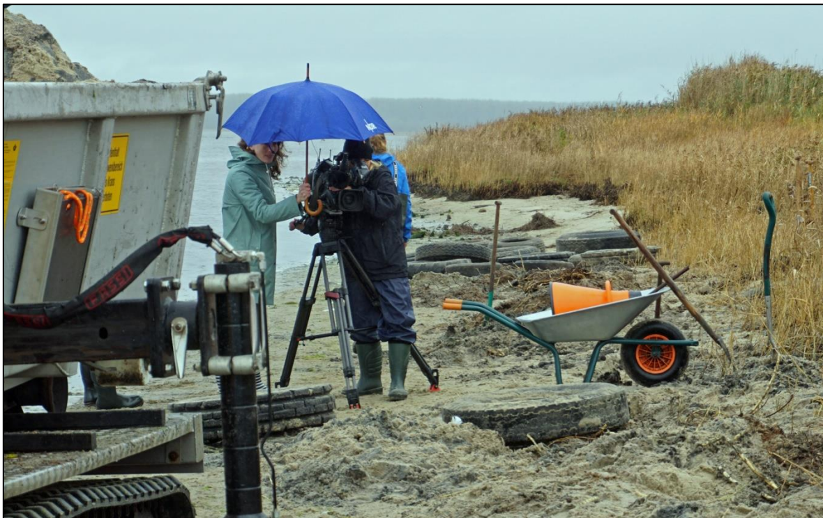
Abb. 14: Interessiert schaut die Presse, hier der NDR, zu