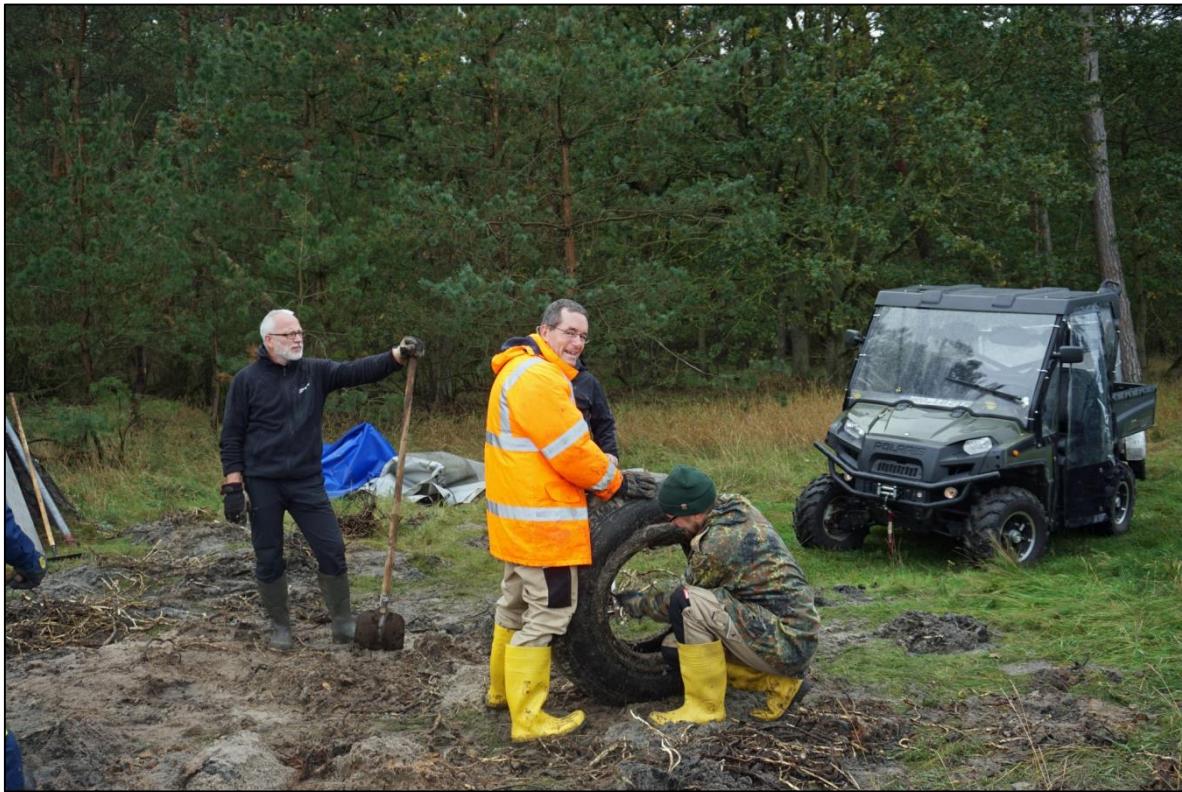
Abb. 9: Auch das Entfernen von Sand und Schilf-Rhizomen ist mühsam