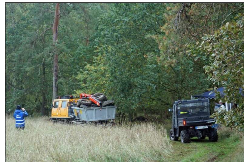
Abb. 20 (Abb. 17-20 – Fotos: C. Luhr)