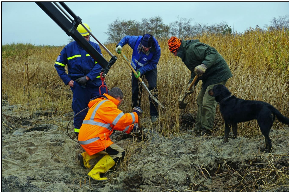
Abb. 12: Freilegen und Schnüren der Altreifen mit dem Kranseil-Gehänge