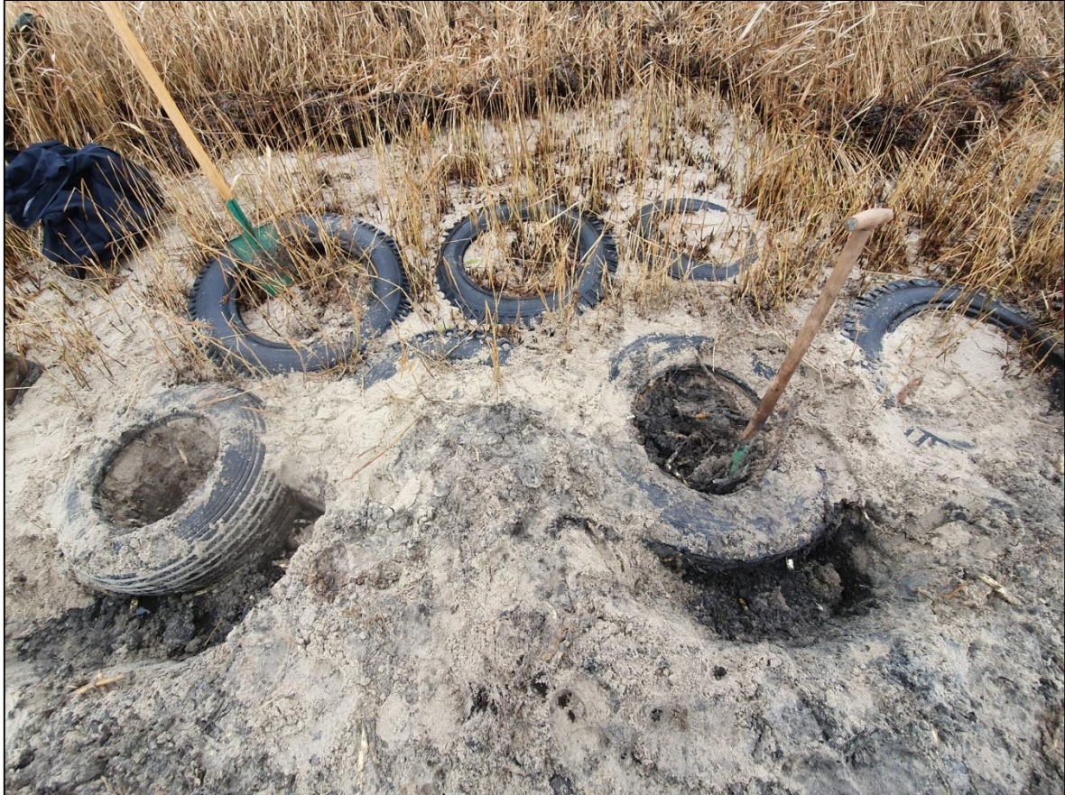
Abb. 11: Bei den eingewachsenen Reifen werden nur noch Durchbrüche für die Kranseile gegraben