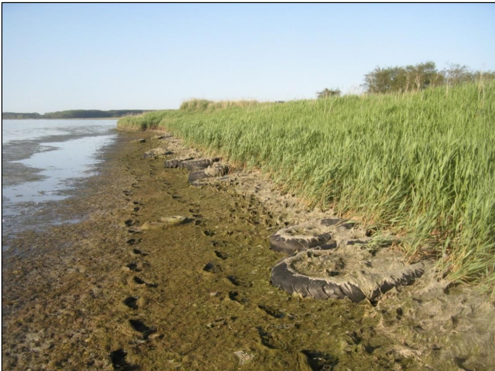
Abb. 2: Altreifen am Salzhaff-Ufer/Hellbach-Mündung