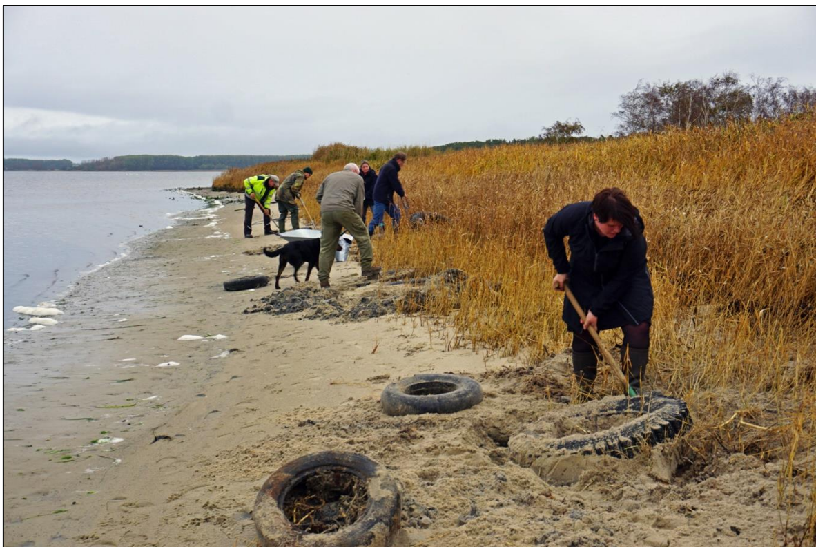
Abb. 4: In mühsamer Handarbeit legen die freiwilligen Helfer die eingesandeten Reifen frei