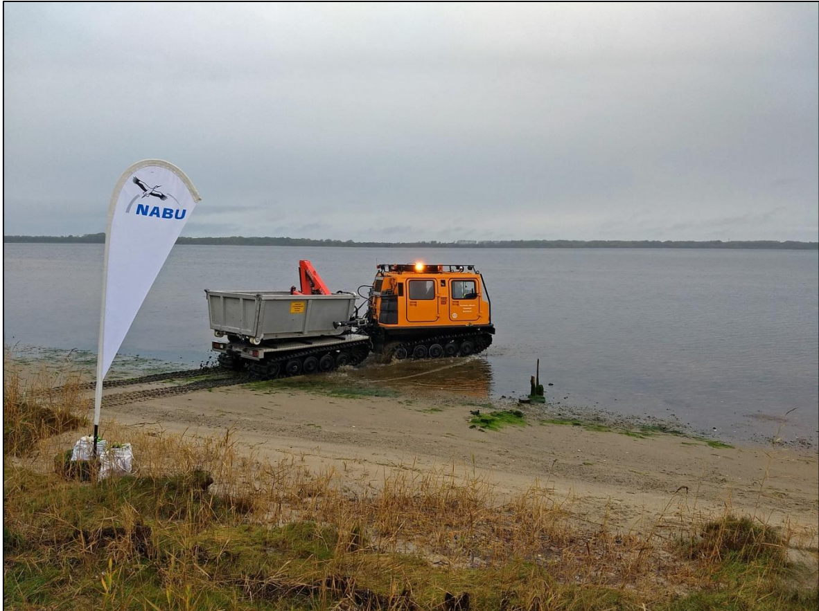
Abb. 3: Start der Reifenbergung mit dem Häßglunds-Fahrzeug des THW