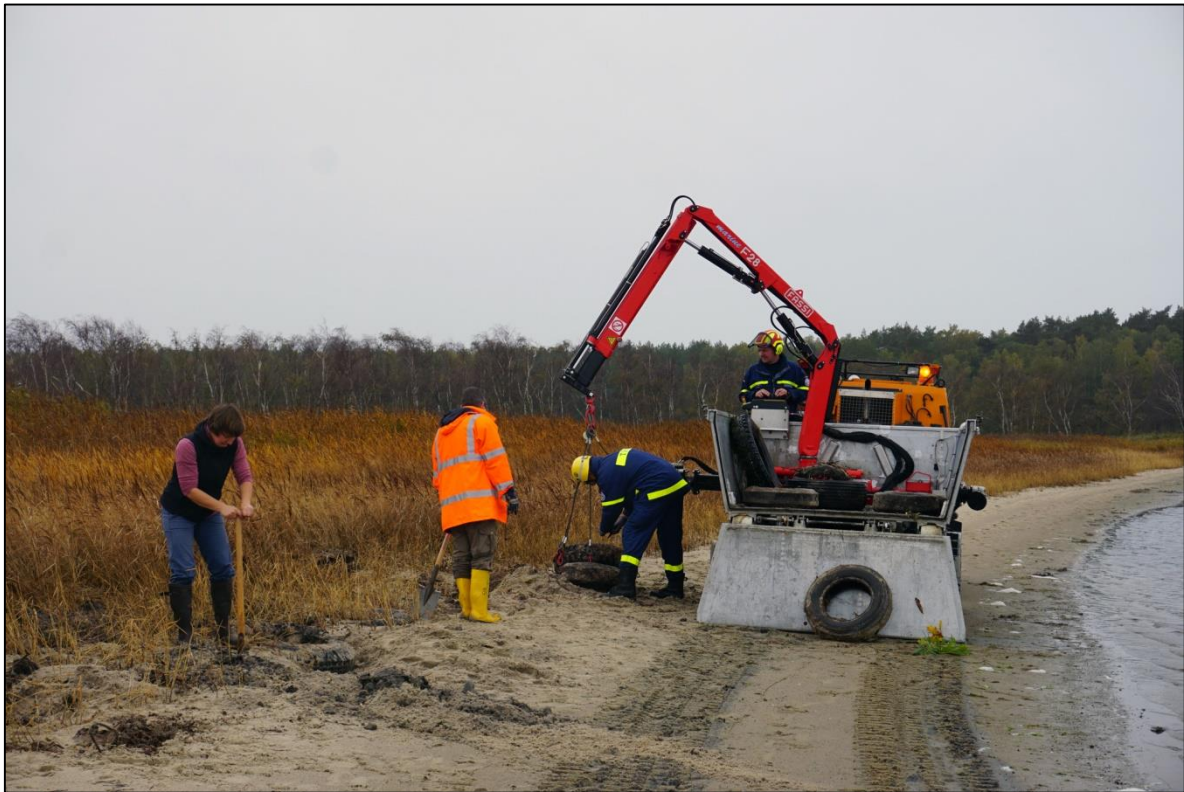
Abb. 5: Die ausgegrabenen Reifen werden auf die Hägglunds-Mulde geladen